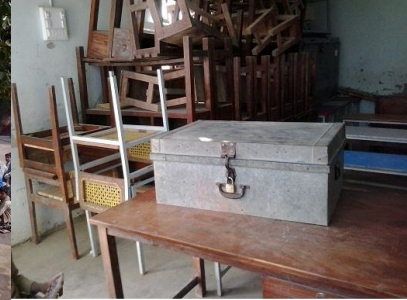
Furniture &amp; school record piled behind the classroom, Mgarh

جيڪڏهن ڌيان سان چوند ڪري، سهڻن اڪرن ۾ اسڪول جي اندر توڙي ٻاهر پيٽن تي آفتن جي خطرن ۾ گهٽتائيءَ متعلق مختلف پيغام لکيا وڃن ته اهي پڻ چڱو اثر ڇڏيندا. اسڪول انتظاميه ۽ مقامي تعليم کاتي سان لهه وچڙ ۾ اچي ان قسم جي ڪوشش وٺي سگهجي ٿي.