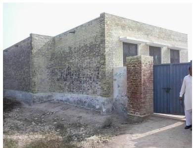
Flood & seepage affected GGPS, Jampur (Dis. Rajanpur)

اها ڏاڍي خوش آئند ڳالهه آهي ته تقريبن هر اسڪول ۾ ايس ايم سي موجود آهي. جيتوڻيڪ سندس ڪردار تمام گهڻو محدود آهي، اڪثر سندس ميمبر يا ته ايترا سرگرم ڪونهن يا وٽن گهريل ڄاڻ ۽ اثر ڪونهي، جو اهي شاگردن جي حق ۾ بهتر فيصلا لاڳو ڪرائي ڪن پتلا يا رپڙ جون مهرون آهن، آما صدقنا پيا ڪن. اتي اهو چوڻ به