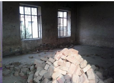
GBPS displays 100% achvmt. on missing facilities with others A School Room in GGMS, Maqsoodpur, Muzaffargarh