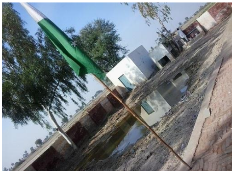
GBPS, BglaHidaya, Rojhan. Puddle of water stands in school