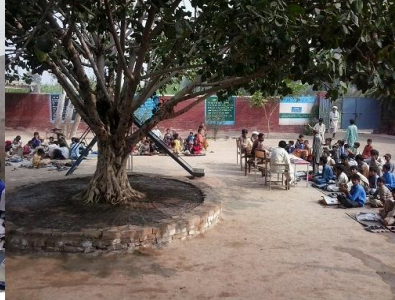
What of other facilities, most children sit on earth, Mgarh