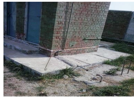
Broken pipelines at GGPS at Sinawan, Mearg