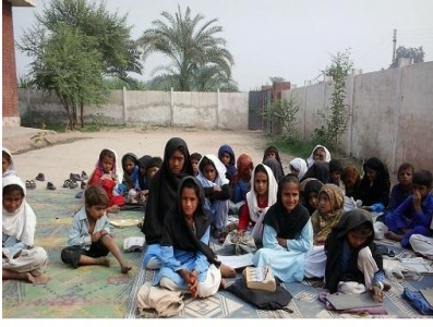
GGPS, Rangpur, MGarh, What of other facilities, most children sit on earth