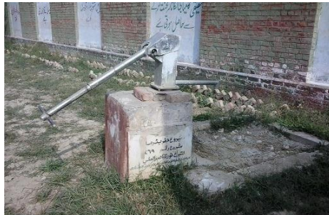
A deserted & dried up handpump in GBPS, Mjzzafargarh