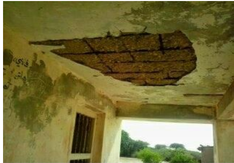
Damaged, One room GBPS Jaati, جڏهن آمريڪي واچوڙو يا مٽيءَ جو طوفان، سنڌ