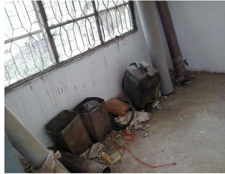
Local landlord's tubewell stuff lying in GBPS, M.Garh

جيڪڏهن ڌيان سان چوند ڪري، سهڻن اڪرن ۾ اسڪول جي اندر توڙي ٻاهر پيٽن تي آفتن جي خطرن ۾ گهٽتائيءَ متعلق مختلف پيغام لکيا وڃن ته اهي پڻ چڱو اثر ڇڏيندا. اسڪول انتظاميه ۽ مقامي تعليم کاتي سان لهه وچڙ ۾ اچي ان قسم جي ڪوشش وٺي سگهجي ٿي.